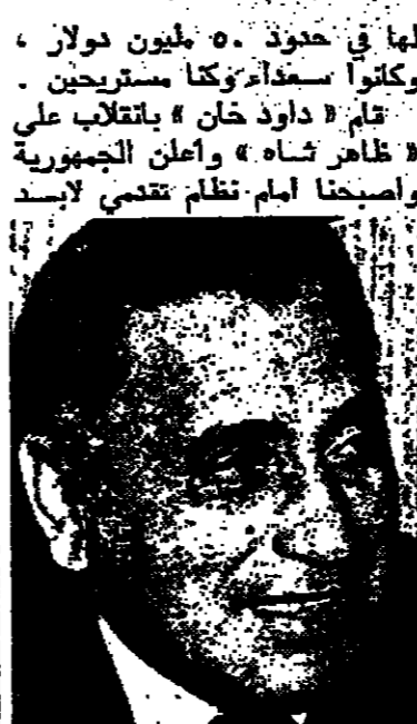
لنا أن نساعدته وزادت مساعداتنا لاتحاد السوفياتي الى ١٥ مليون دولار في عام ١٩٧٩. في ظل هذه الظروف، وأعلنت أفغانستان جمهورية شعبية ثورية، وطلبنا «تراشي» زعيم الثورة - بتكليف بمساعدتنا ومصلحت هذه المساعدات الى حدود ٥٠٠ مليون دولار سنويا.

لها في حدود ٥٠ مليون دولار، وولتي، تستطيع ان تنجح فيما قطعنا لكي تحصل على نياحة خلو-، ولكني يحصل بخراتها على فرصة بدون فيها اعدامهم براحة من تجارة حركة الامواج.